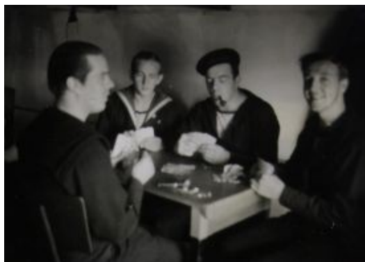
Ham med piben tabte 150 kr denne aften

Der levede vi i en måned i pragtfulde forhold. God mad, opvarmet svømmebassin. Film og optræden af kendte kunstnere hver aften.