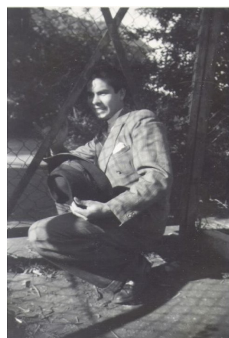
Venstre: Jeg og lange Blomgreen med en fnisende tysk vagt bag os . Midt: Jeg springer fra 10 meter vippen. Højre: Jeg sniger mig ud til friheden gennem hullet i hegnet, til pigerne i Nyhavn, medens vagten ser den anden vej

Senere blev der lavet hul i hegnet om KB anlægget så gasterne kunne tage til Nyhavn om aftenen. De tyske soldater, som holdt vagt, vendte venligt ryggen til. Efter en måned, blev vi sendt hjem.