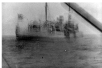
Den synkende Hvidbjørn

Det ville tyskerne ikke lade sig byde og hejste det tyske flag igen, hvorefter de forlod Hvidbjørnen. Minsandten, kort efter blev det tyske flag sænket og det danske kom op. Hvordan kadet Brink kom fri af skibet vides ikke. Medens Hvidbjørnen sank, råbte klumpen af de i vandet plaskende mennesker, hurra!