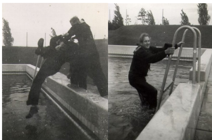
Han kom til at drysse cigaretaske ned i vandet. Så måtte han selv en ur i vandet.

Senere blev der lavet hul i hegnet om KB anlægget så gasterne kunne tage til Nyhavn om aftenen. De tyske soldater, som holdt vagt, vendte venligt ryggen til. Efter en måned, blev vi sendt hjem.