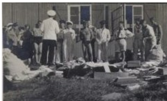
Tårnborghøjeren i Korsør